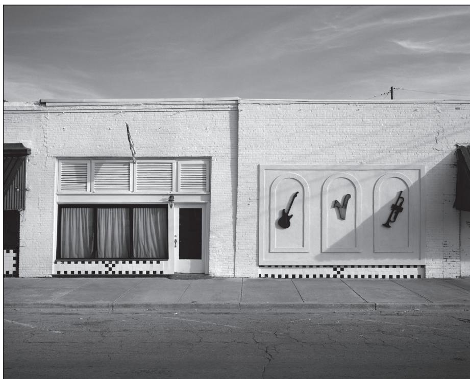
Jazz-Club North Main Street, Leland, Mississippi 2016, © Jörg Rubbert (O.i.F.)