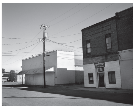
Sports-Bar Greenwood, Mississippi 2016