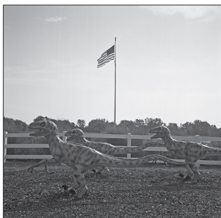
Animal Sculpture, Hastings, Michigan 2017

Finissage: Freitag, 26. Oktober 2018 18 – 21 Uhr